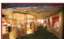
奈良まほろば館 内観